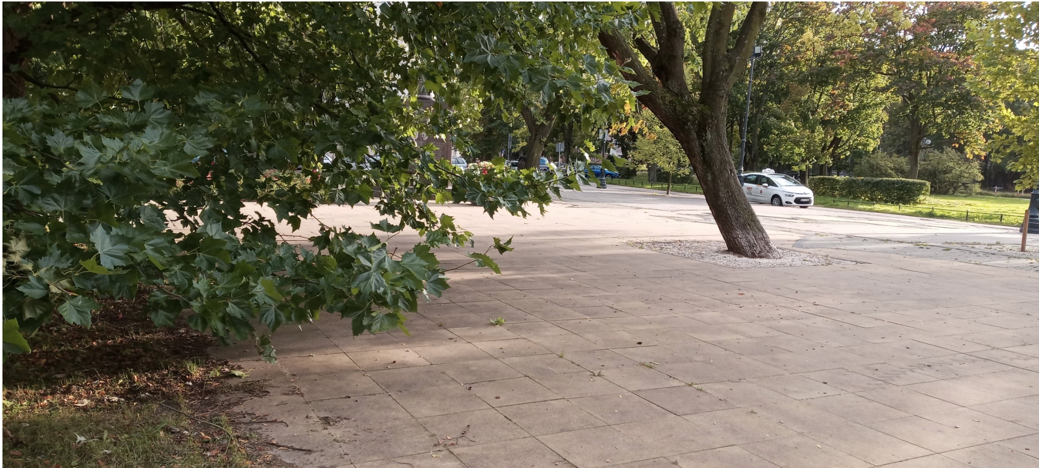
Betonoza – przykład z warszawskiego Żoliborza