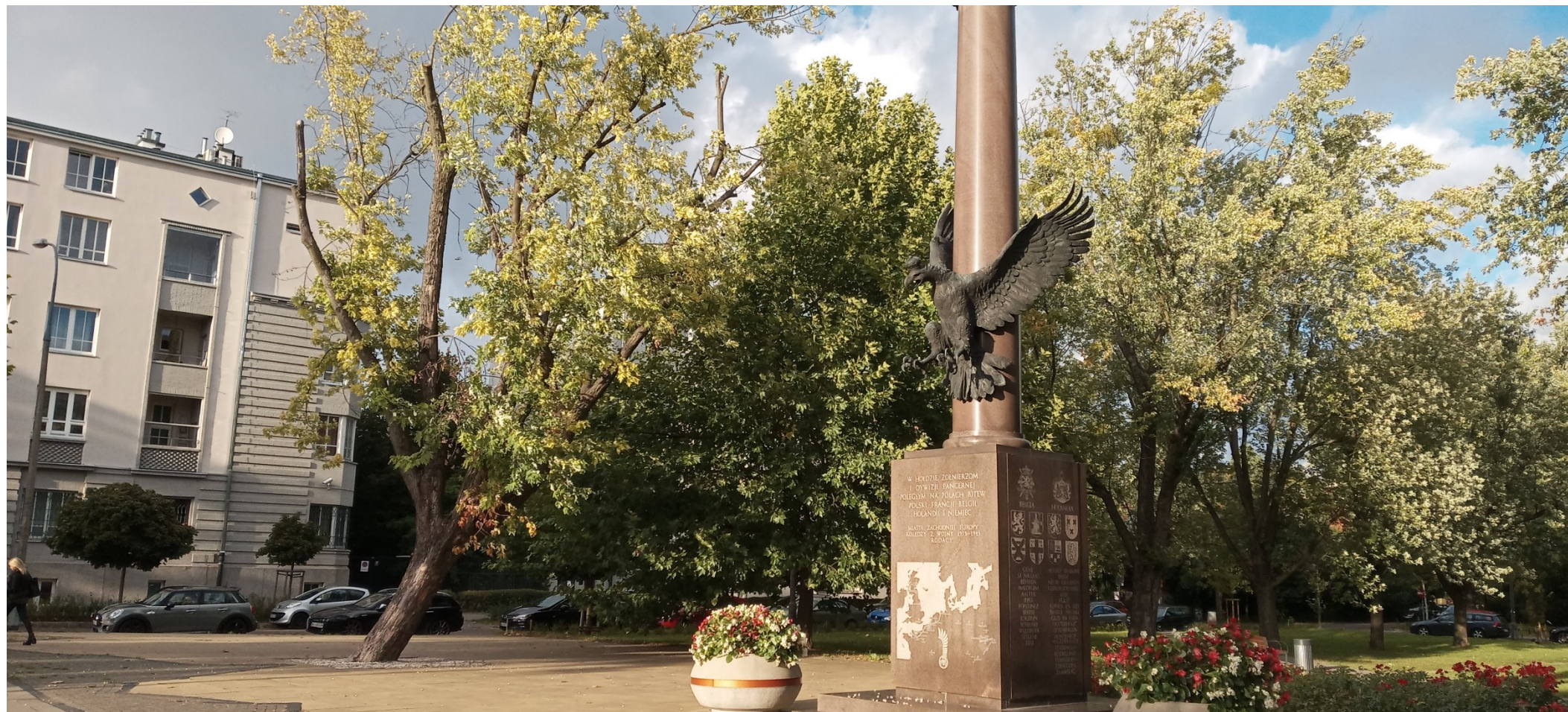
To samo miejsce